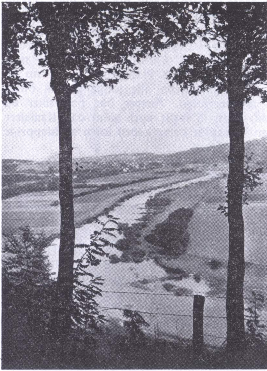
Blick vom Kettwiger Stadtwald auf Werden